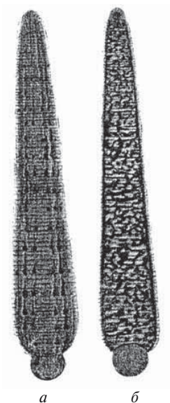
Рис. 8. Лечебная медицинская пиявка: а — вид со спины; б — вид с брюшка

В Закавказье — Грузии, Армении, Азербайджане — распространена разновидность лечебной пиявки (рис. 9), отличающаяся ярко-зеленой общей окраской спины, четырехугольной формой пятен, расположенных на желтых полосах, и сильным развитием черного пигмента на брюшке. Последнего так много, что от зеленого пигмента остаются только небольшие пятна, располагающиеся попарно через правильные промежутки.